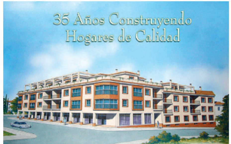
RESIDENCIAL MONTECRUZ, LA ZUBIA (GRANADA)