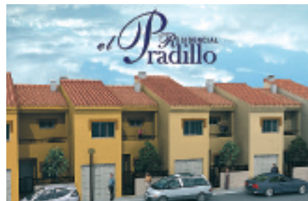
RESIDENCIAL "EL PRADILLO", TALAVERA LA REAL (BADAJOZ)

El encauzamiento del río Guadalfeo en Granada, el embalse Beninar en Almería (con sus edificios auxiliares) y el puente de Zulgena