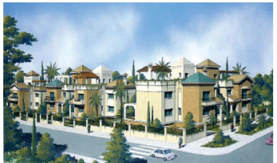
RESIDENCIAL MONTEREY, UBEDA (JAEN)

futuro. Debo comunicar que desde GEGISA hemos propuesto uno en Extremadura que será, si Dios quiere, uno de los más novedosos, inteligentes y originales de España: un puerto de mar en Extremadura".